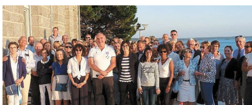
La remise des dons s'est déroulée durant le pique-nique de l'Adosm.